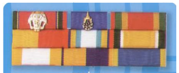
แพรแถบย่อเครื่องราชฯ