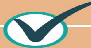
ภารกิจที่ 5 ด้านการอนามัยสิ่งแวดล้อม และ สุขาภิบาล