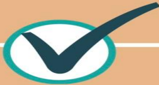
ภารกิจที่ 4 ด้านการควบคุมและ ป้องกันโรค