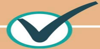
ภารกิจที่ 6 ด้านการควบคุม และบังคับใช้ กฎหมาย