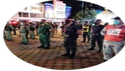
ภารกิจที่ 2 ด้านการรักษาความปลอดภัย