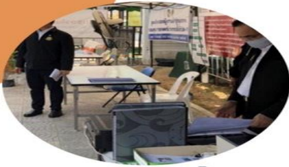
ภารกิจที่ 1 ด้านอำนวยการและธุรการ