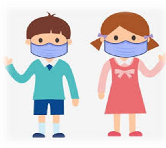
M ask wearing