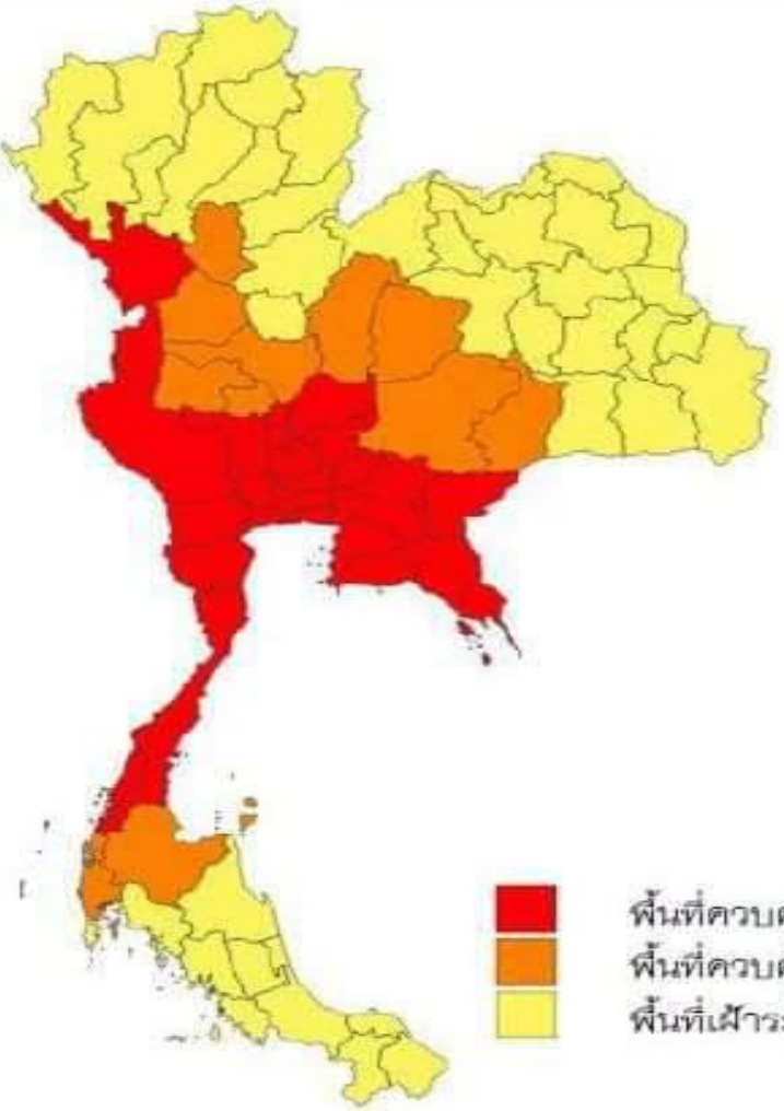
■ พื้นที่ควบคุมสูงสุด 28 จังหวัด ■ พื้นที่ควบคุม 11 จังหวัด ■ พื้นที่เฝ้าระวังสูงสุด 38 จังหวัด