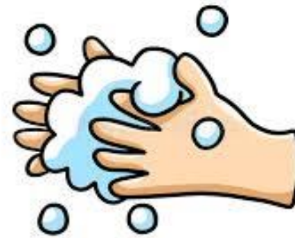
H and washing